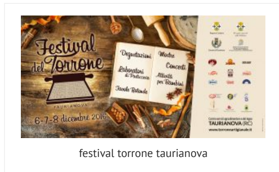
festival torrone taurianova